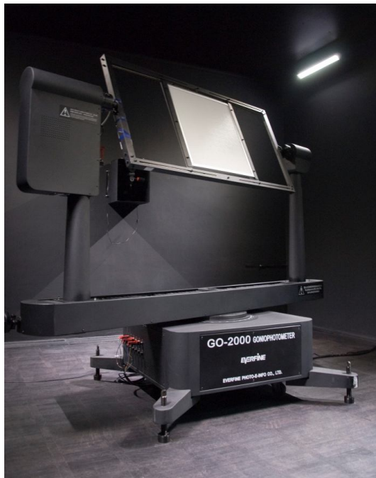
Рис. 1. Гоніофотометр Everfine GO-2000H в темній кімнаті зі змонтованим досліджуваним зразком

Одним з основних робочих інструментів Центру є автоматизований гоніофотометр Everfine GO-2000H (рис. 1), який складається з поворотного механізму (зображений на фото), фотоприймача, блоку керування та блоку живлення досліджуваного зразка. Процес вимірювання виконується в так званій «темній кімнаті» – фотометричному тунелі довжиною 16 метрів, в якому всі поверхні пофарбовані чорною фарбою для зниження впливу розсіяного світла. Поворотний механізм та фотоприймач встановлюються на різних кінцях приміщення. Процес вимірювання просторового розподілу сили світла передбачає обертання поворотним механізмом досліджуваного зразка навколо його фотометричного центру та послідовні вимірювання сили світла в напрямі фотоприймача.